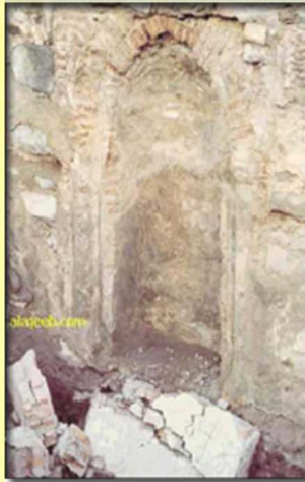
ئەو ئولتگەرەهێ گە پێخە مەبەر سەرامی خوای لەسەر بێ پێخوێزی نێرەر لۆهگەلی تیا دەگرت